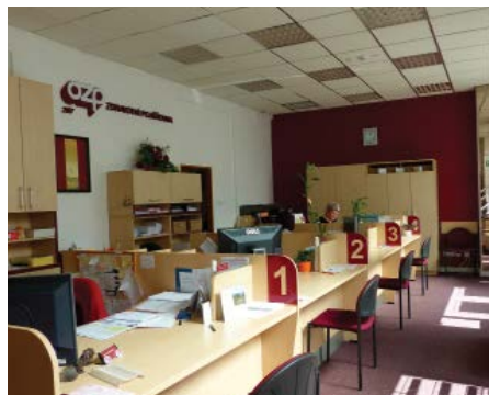
interiér nového klientského centra v Ostravě.