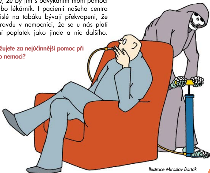
Ilustrace Miroslav Barták