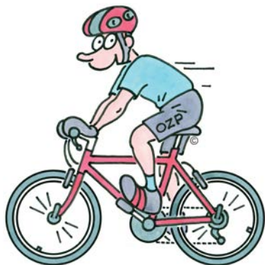
Kresba: Jaroslav Kerles

Na mém facebooku to žije. Je vás už přes 14 000! Jsme už taková větší facebooková OZP rodina. Děkuji za vaši přízeň a podporu a doufám, že vás přibude ještě víc. Být fandou OZPáčka se vyplatí v každém případě.